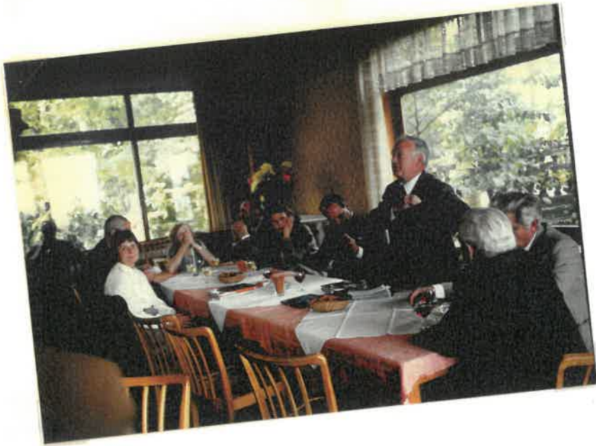
Sonntag 7.10.79 11 00 Uhr Frühschoppen im Bergisel-Restaurant