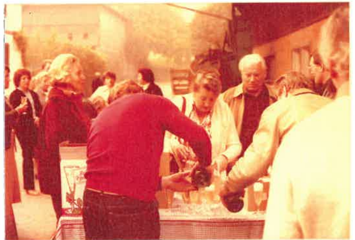
Ankunft im Gundolfinger-Hof (Schweiz) zu einer zünftigen Vesperpause